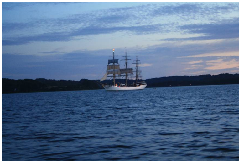
Skoleskibet "Danmark" på vej ud af Genner Bugt.

Omkring solnedgang dukker først en lille fok (trekantet sejl) op i stævnen på skibet og meget langsomt drejes stævnen rundt mod østlig retning og med yderligere 4 råsejl oppe går det hen imod klokken 21.30 med ca. 3 knob ud gennem Genner Bugt.