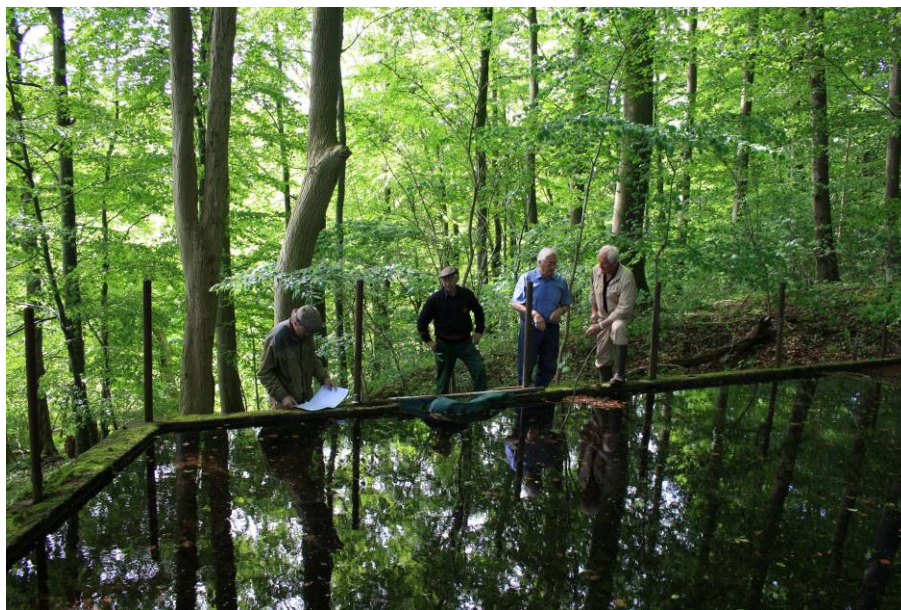
Der studeres papirer og diskuteres. 2. juni 2010

Specielt i forbindelse med aftenmalkningen, hvor det gælder om at få nedkølet den nymalkede mælk hurtigst muligt, er der ofte problemer med vandforsyningen. Nedkølingen af mælken sker ved at lade vand i en slags vandret karrusel risle ned over mælkejugen; samtidig hermed drejer vandstrålen en omrører rundt i malkejugen